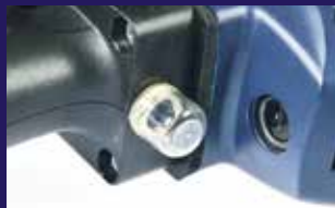
Optischer Überlastschutz für mehr Kontrolle