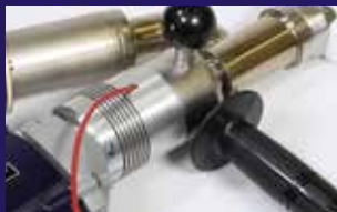
Einsetzen der Schweissstäbe auf beiden Seiten für flexible Schweisspositionen