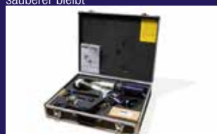
Stabiler Transportkoffer garantiert Ordnung und staubfreie Aufbewahrung (im Lieferumfang enthalten)