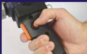
Arretierbare Taste für kontinuierliches Extrusionsschweißen mit geringem Aufwand