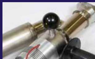
Griff und Knopf lassen sich auf beiden Seiten anbringen, damit Ihr Werkzeug sauberer bleibt