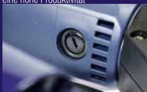
Schnell und einfach austauschbare Kohlebürste