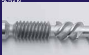
Hochwertige Schraube für längere Lebensdauer