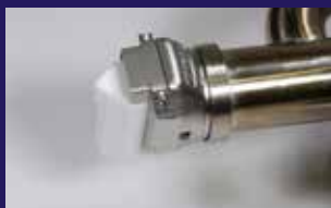
Schnell wechselbare und um 360° drehbare Schweisschuhe ermöglichen eine hohe Produktivität