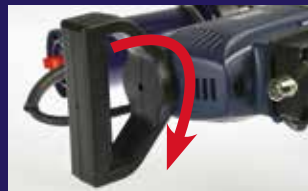
Drehbarer Griff für eine verbesserte Ergonomie